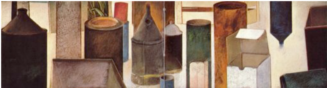
Nature morte avec plusieurs boites et un livre, 1977, pastel sur papier, 50 x 180 cm